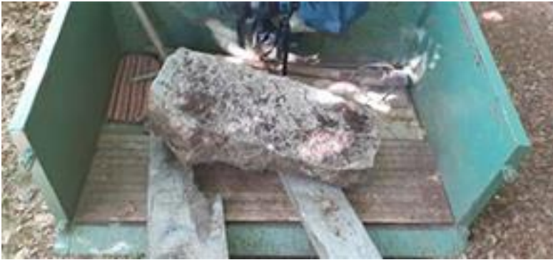
Déchargement du bloc de granite.