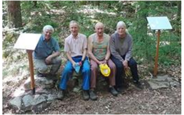
Le chantier des Sagnes est terminé.