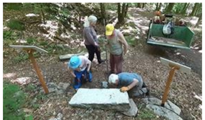
Le calage est réalisé soigneusement.