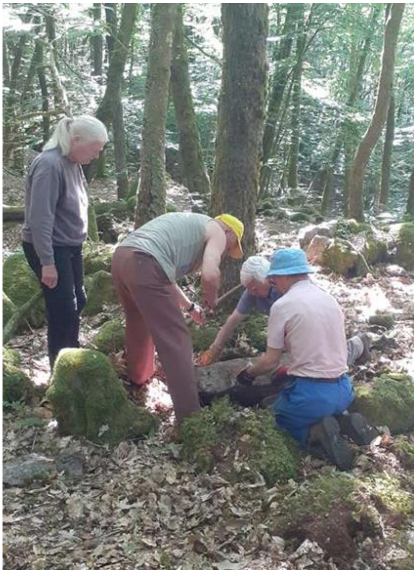
Un bloc de granite est récupéré sur place.