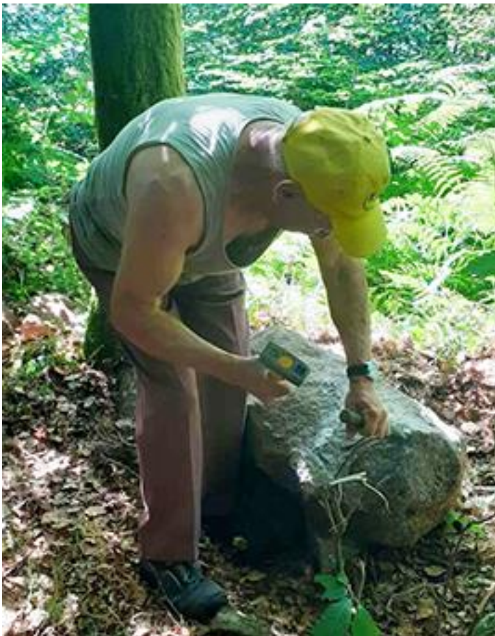
Il a été décidé de laisser le dessus du bloc à l'état brut.